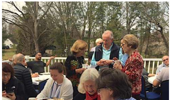
Ayudantes Internacionales del Área III en un descanso para almorzar durante una reunión de 78 ayudantes en el Centro Amani de Subud Washington, D.C.