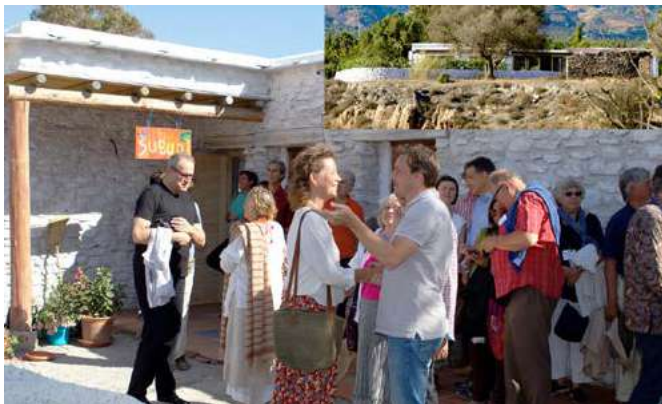
Miembros reunidos en el exterior de la casa Subud de Alpujarra en España con motivo de su gran inauguración en septiembre de 2016 .

La inspiración original para la Fundación era la idea de que se podría crear un núcleo de fondos de inversión a partir de testamentos de miembros a través de sus legados a la Fundación. De acuerdo con la guía en 2013 de Ibu, la Fundación no debe recaudar fondos; sin embargo, el cumplimiento de la misión incluye la conservación y expansión de las inversiones a largo plazo que generan su capacidad para otorgar subsidios. Recordamos a los benefactores con profunda gratitud.