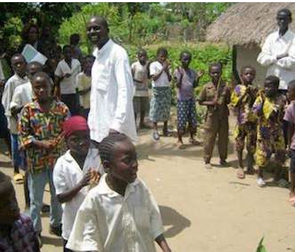
Children from the Albadi home in DR Congo.