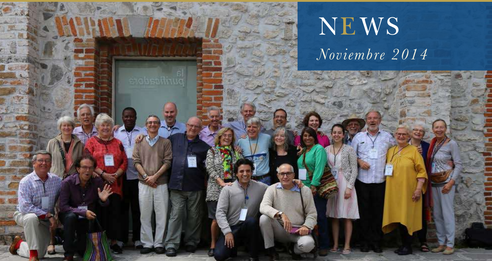
El equipo de la MSF, los directores de la WSA y amigos en el Congreso Mundial, Puebla.