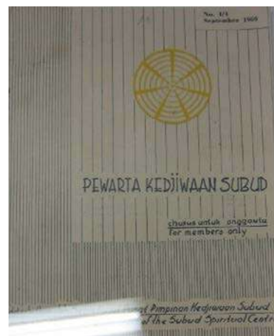
El primer Pewarta —uno de los miles de materiales impresos en los archivos de Gilandak.

Durante su vida Bapak dio más de 1.700 charlas, pero sólo existen 1.316 y muchas de estas charlas originales grabadas estaban en peligro de deterioro y de perderse para siempre.