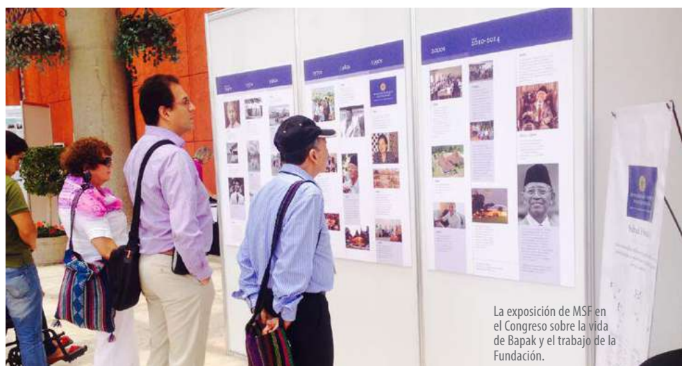
La exposición de MSF en el Congreso sobre la vida de Bapak y el trabajo de la Fundación.