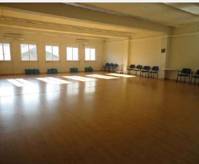
Sala de latihan, Subud Lisboa

D urante la Asamblea General Anual de la Fundación, la Junta aprobó las solicitudes de subvención. A Subud Puebla, México, se le concedieron US$ 8.000 para ampliar sus actuales instalaciones. Subud Istmina, Colombia, recibió US$ 3.750 para equipamientos de cocina y hacer mejoras en las conexiones eléctricas. Y a Subud Lisboa, Portugal, se le concedieron US$ 24.000 para ayudar al grupo a amortizar el préstamo bancario para su Casa Subud.