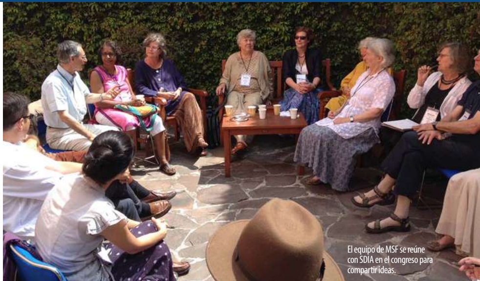
El equipo de MSF se reúne con SDIA en el congreso para compartir ideas.