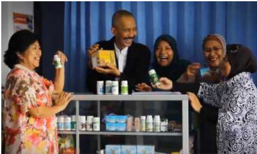
Membres à Malang qui ont commencé de petites entreprises pour aider à soutenir le groupe.