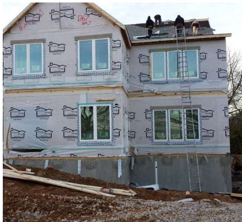
Le nouveau centre doit être terminé pour la fin Mai.

“Notre mission est d'édifier un Centre Subud durable : soutenir la croissance et le développement de Subud, du niveau local à l'international ; fournissant une place de dignité – un foyer pour le latihan pour tous en Subud ; exprimant les fruits du latihan à travers les initiatives des jeunes et d'autres projets humanitaires et culturels ; une place pour nourrir les entreprises humaines pour les membres et les voisins.” Extrait de la Déclaration de Mission de Subud Washington, DC.