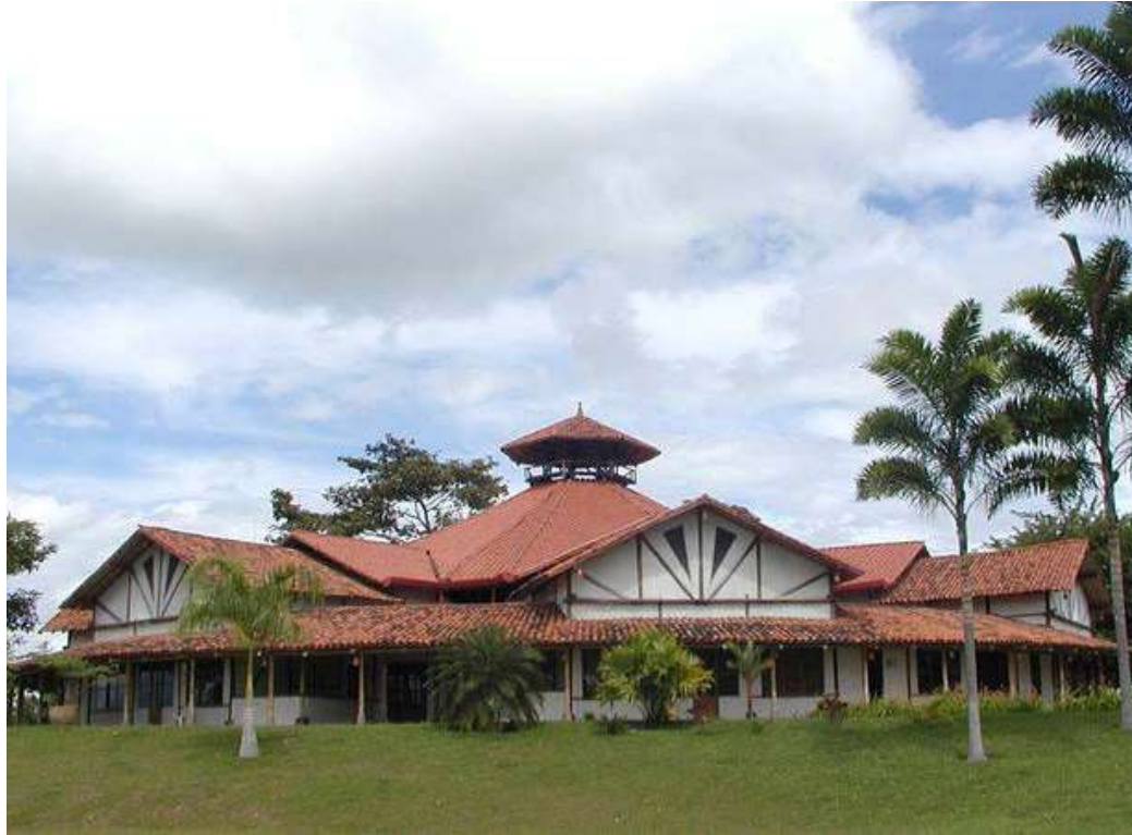
Amanecer a été construit à temps pour le Congrès Mondial Subud de 1993. Des entreprises aident maintenant à soutenir le centre.

Un bon exemple est celui des membres Subud de Seattle, aux États-Unis, qui ont reçu une subvention de la Fondation pour améliorer leur maison Subud.