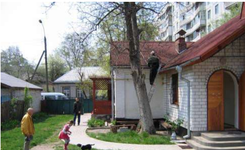
Maison Subud en Ukraine

“ Tout ceci se réalisera si vous êtes sincères, si vous êtes, non pas volontaires mais sincères dans la poursuite de votre objectif d’avoir votre propre salle de Latihan. Alors peut-être, à cause de la sincérité de votre cœur, vous serez en mesure non seulement de louer une salle, mais vous serez capables d’acheter et de construire un lieu. Quant à la façon dont vous allez y arriver : si vous êtes sincères, Dieu vous montrera le chemin.”