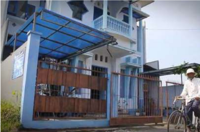
Extérieur de la maison Subud à Malang, Indonésie