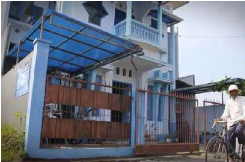
Exterior de la Casa Subud en Malang, Indonesia.