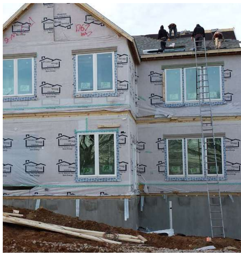
El nuevo centro debe estar terminado para finales de Mayo

“Nuestra misión es construir un Centro Subud sustentable: apoyando el crecimiento y desarrollo de Subud tanto local como internacionalmente; proporcionando un espacio digno, un hogar para el latihan para todo Subud; expresando los frutos del latihan a través de iniciativas juveniles y otros proyectos humanitarios y culturales; un lugar para alimentar los esfuerzos humanos para miembros y vecinos.”