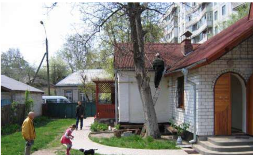
Casa Subud en Ucrania.

“Todo esto sucederá y podrá ser logrado si ustedes son sinceros, si ustedes sin obstinación y con sinceridad persisten en su meta de tener un lugar propio para el latihan. Entonces, quizá debida a la sinceridad de su corazón ustedes serán capaces no sólo de alquilar un lugar, sino capaces de comprarlo y construirlo. En cuanto a cómo conseguirlo: si ustedes son sinceros, Dios les mostrará el camino”.