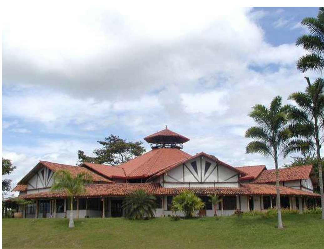
Amanecer se construyó a tiempo para el Congreso Mundial Subud en 1993. Ahora algunas empresas ayudan a mantener el centro.

D esde que la Fundación Muhammad Subuh fue establecida en 1991, ha sido su prioridad el apoyo a los grupos para que obtengan sus propios locales para el latihan. En 1993, la Fundación concedió su primera subvención para la construcción de la Sala de Latihan del Centro Internacional Subud en Amanecer, Colombia, donde se celebró el Noveno Congreso Mundial Subud ese mismo año.