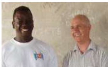
Foto: Samuel visita un colegio apoyado por Subud en la RD del Congo, 2009