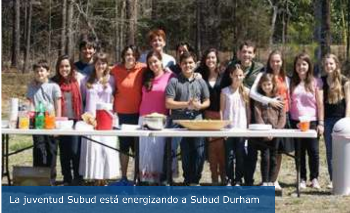
La juventud Subud está energizando a Subud Durham