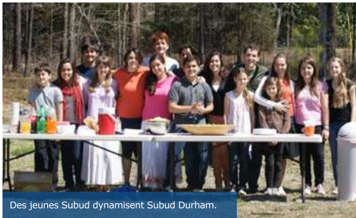
Des jeunes Subud dynamisent Subud Durham.