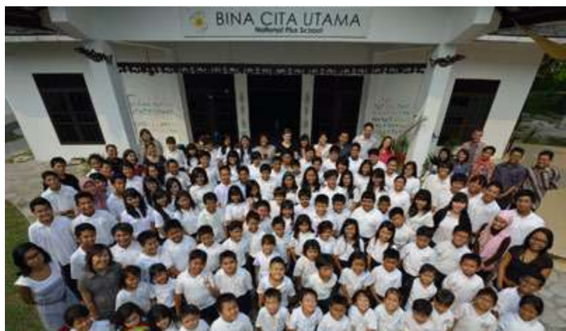
Estudiantes y profesores del BCU, 2012.