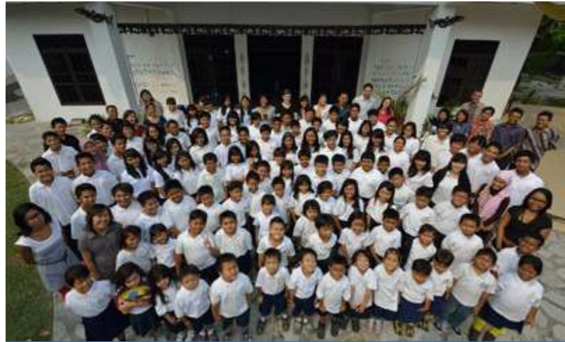
Les étudiants et les enseignants de BCU, 2012

Notre objectif n'est pas seulement de relever le niveau de l'éducation dans le Centre de Kalimantan, mais de produire des êtres humains utiles, nobles qui aideront cette province à croître dans le bon sens.”