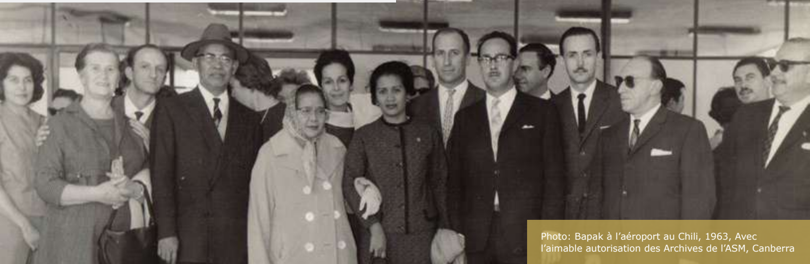
Photo: Bapak à l'aéroport au Chili, 1963, Avec l'aimable autorisation des Archives de l'ASM, Canberra

Extrait de Subud World News, 1974 Avec l'aimable autorisation des Archives de l'ASM, Canberra Courtesy WSA Archives, Canberra