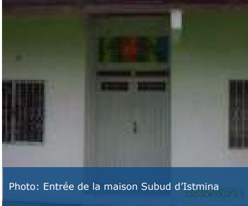
Photo: Entrée de la maison Subud d'Istmina