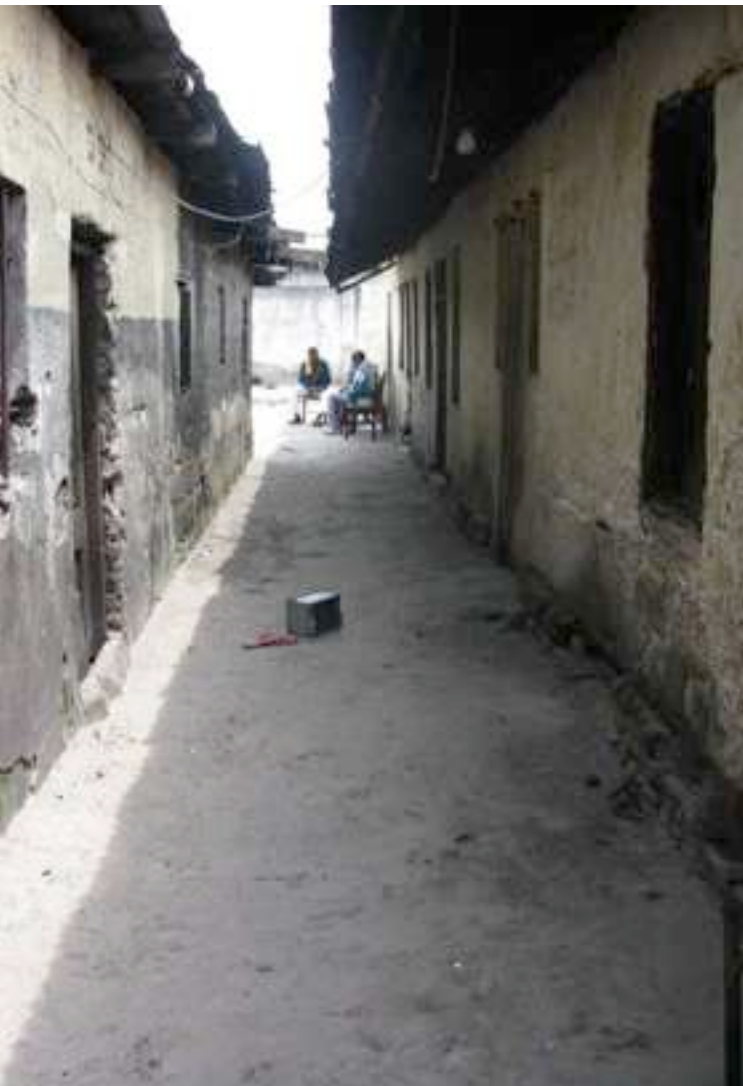
La nueva Casa Subud provee un espacio más amplio, sin embargo aún se necesitan hacer muchos trabajos.