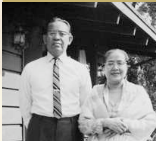
Bapak e Ibu en Vancouver, 1963

Preservando la palabra de Bapak para la Humanidad