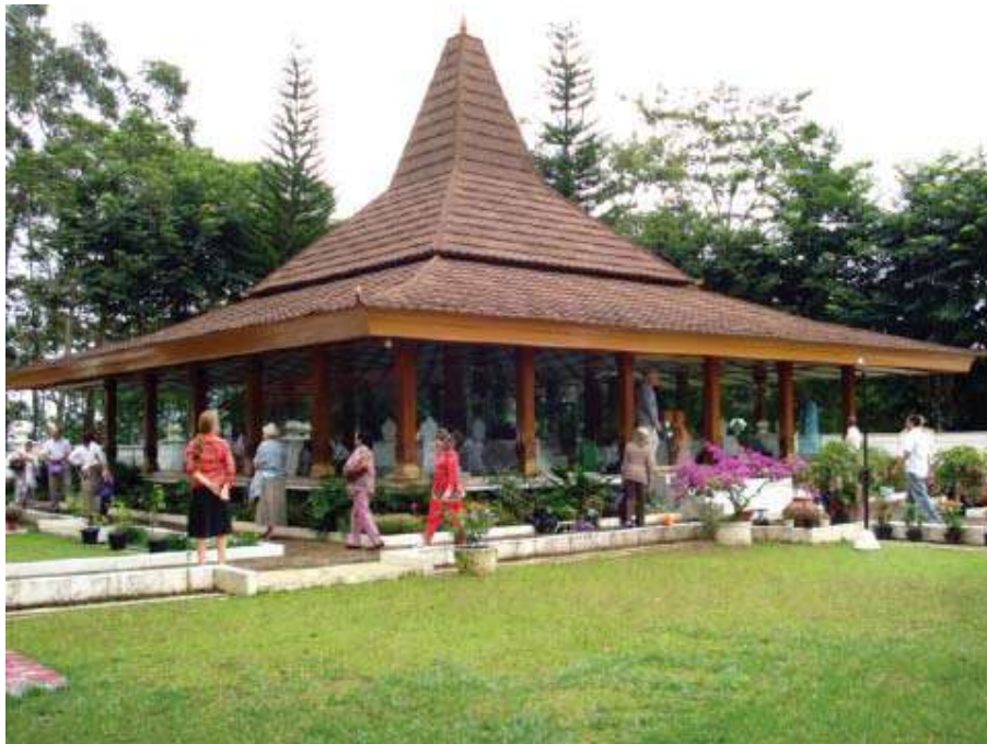
Photo de couverture et dessus : Membres Subud rendant hommage à la tombe de Bapak, Suka Mulya, Indonésie.