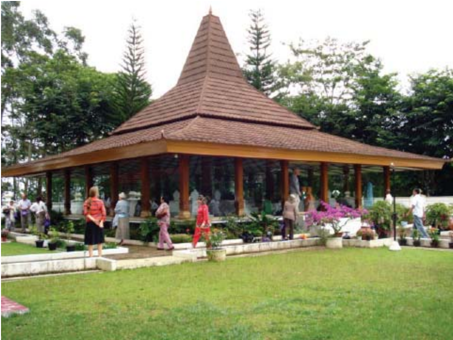
Fotografía de la portada y arriba: Miembros Subud, presentando sus respetos en la tumba de Bapak, Suka Mulya, Indonesia.