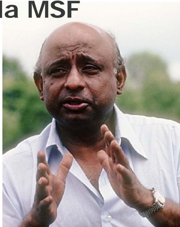
Varindra Vittachi, también conocido como "Tarzie", sirvió en diversas funciones en Naciones Unidas durante más de dos décadas. Se retiró como Subdirector Ejecutivo del Fondo de las Naciones Unidas para la Infancia en 1988.

Los trustees se han comprometido a respetar los importantes principios de transparencia, rendición de cuentas e información, que son esenciales para una institución que busca tener y mantener una relación de confianza y credibilidad con sus miembros.